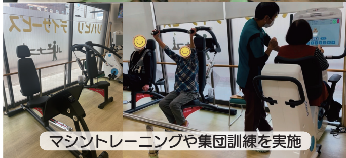
マシントレーニングや集団訓練を実施