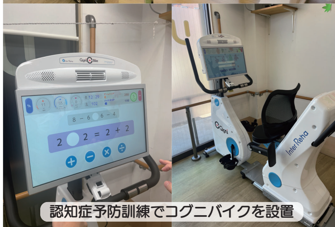
認知症予防訓練でコグニバイクを設置