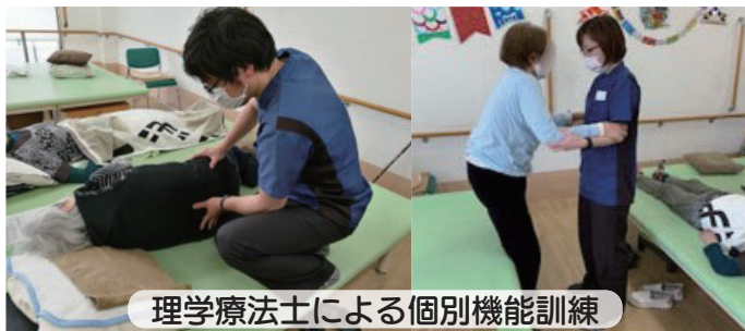
理学療法士による個別機能訓練